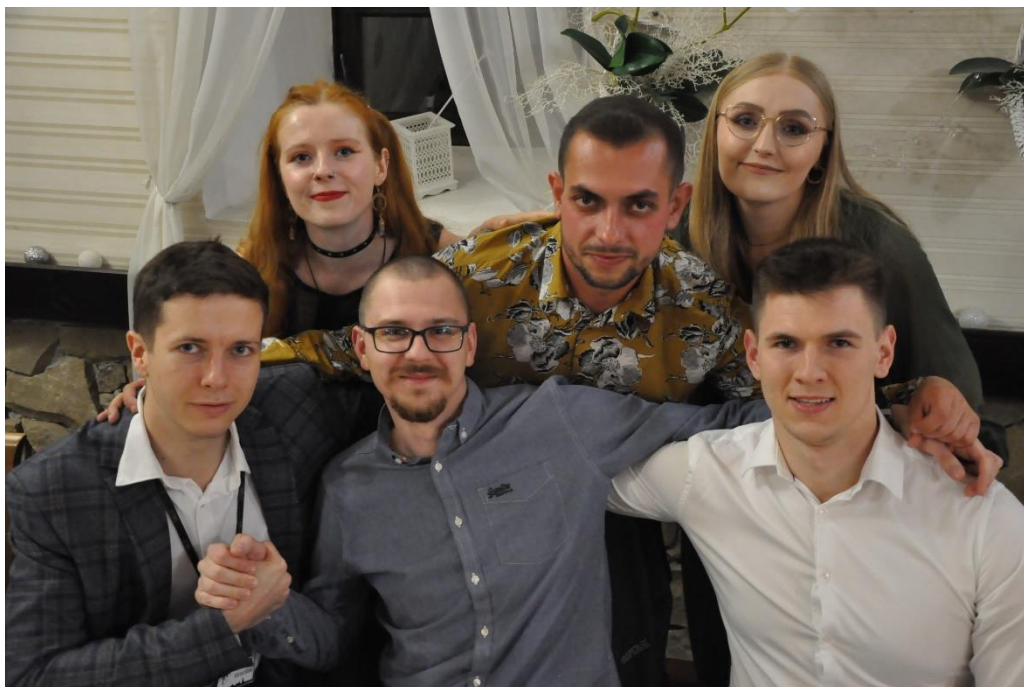
Delegaci Oddziału Wrocławskiego PZITB

Sobota była dniem równie technicznym, jak piątek. Organizatorzy postanowili zabrać nas na dwa wyjścia techniczne na budowy: Szpitala Wojewódzkiego oraz Dworca Metropolitalnego. Była to znakomita okazja do zapoznania się z nowoczesnymi technologiami stosowanymi w budownictwie. Następnie, wraz z przewodnikiem, podziwialiśmy piękno architektury i historii Lublina. Sobotni wieczór również obfitował w rozliczne atrakcje. Oprócz grillowania Lubelskie Koło Młodych przygotowało dla nas konkurs wiedzy na temat PZITB, co stanowiło wspaniałą możliwość dla osób początkujących w PZITB, ażeby dowiedzieć się czegoś więcej o naszym stowarzyszeniu.