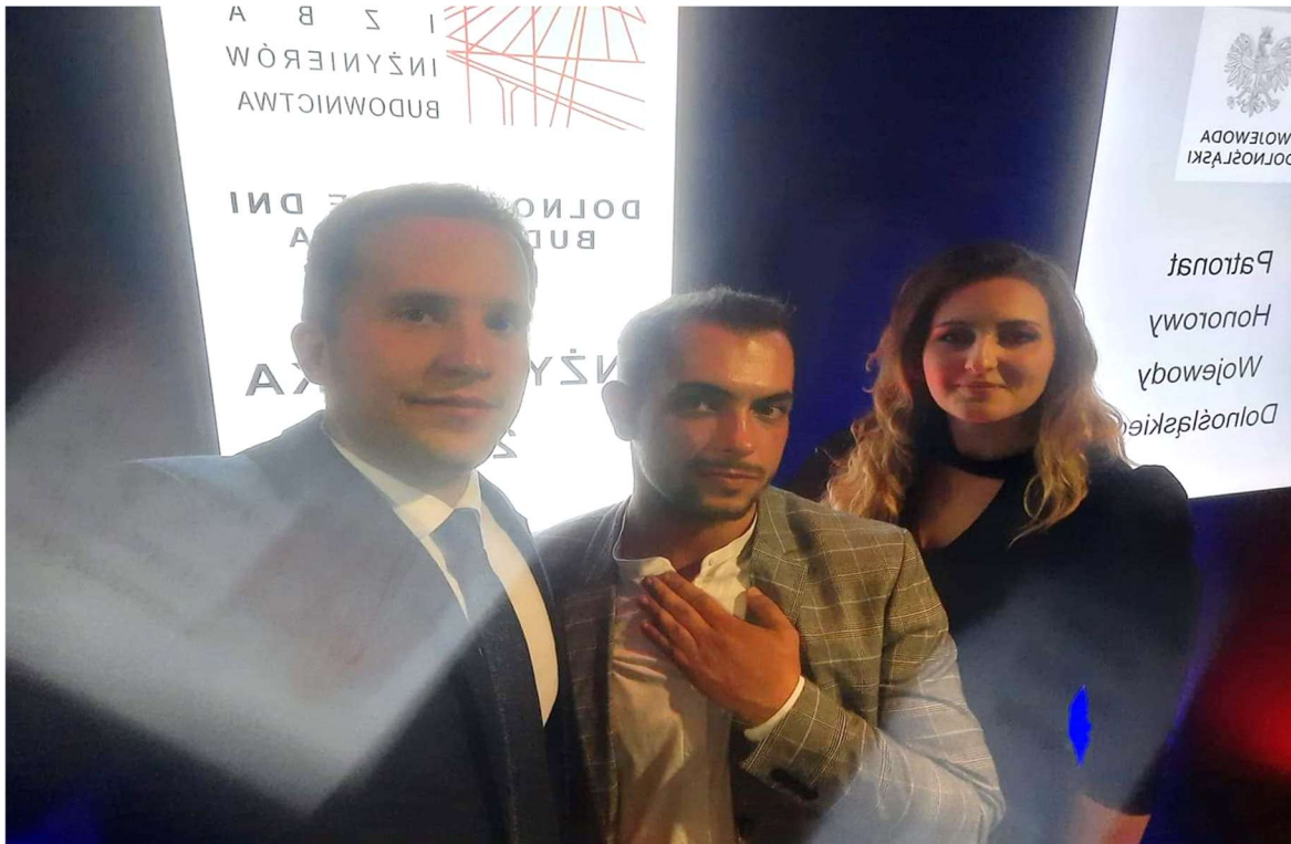
Przedstawiciele Młodej Kadry pomocni w rozdaniu nagród DBR

- W dniu 16.09.2021 r. Komisja Konkursowa na Najlepszą Inżynierską i Magisterską Pracę Dyplomową na WBLIW Politechnice Wrocławskiej w roku akademickim 2019/2020 i w roku akademickim 2020/2021