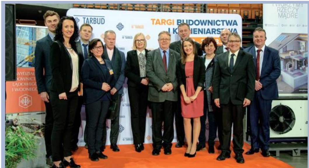
Moment otwarcia Targów.

- Targi Budowlane TARBU D odbyły się w dniach 23 - 25 marca 2018r. we Wrocławskiej Hali Stulecia.