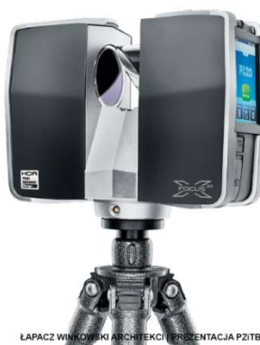
LAPACZ WINKOWSKI ARCHITEKCI | PREZENTACJA PZITB - SKAN 3D