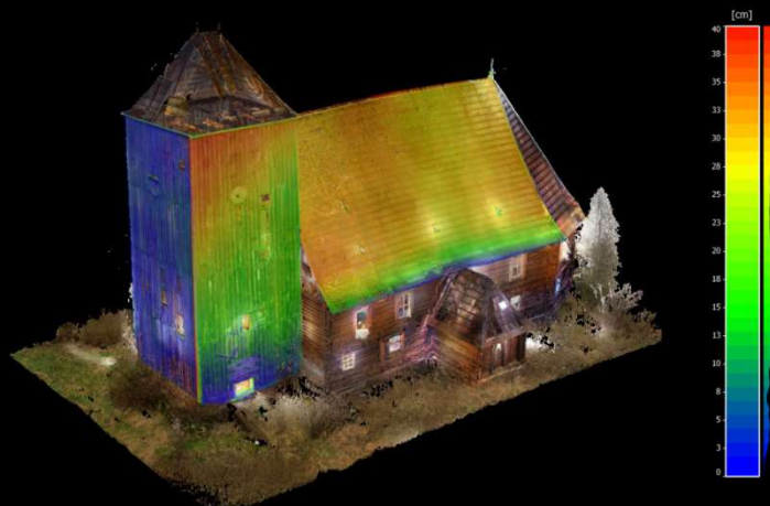
LAPACZ WINKOWSKI ARCHITEKCI | PREZENTACJA PZITB - SKAN 3D